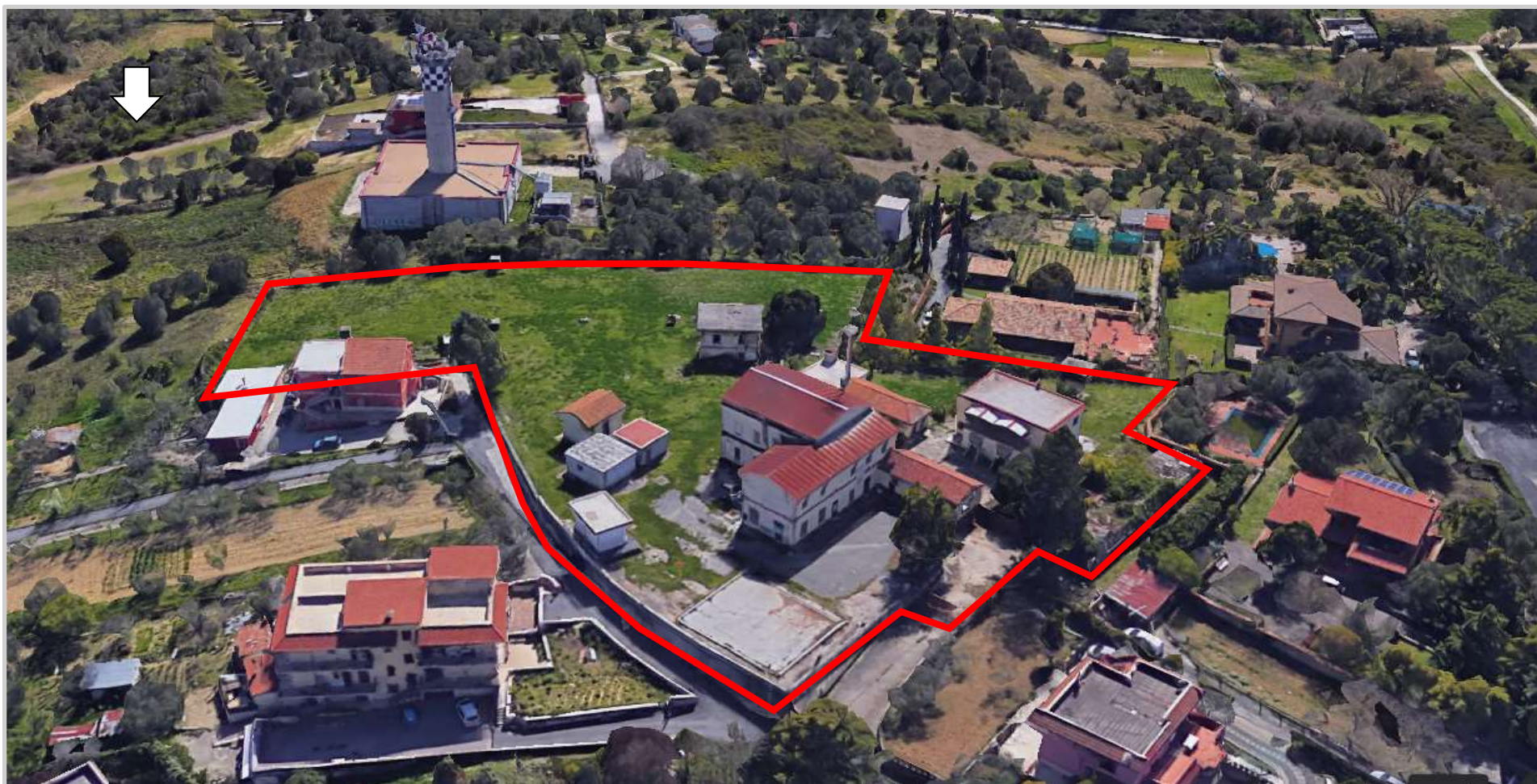
Ortofoto 3d del sedime oggetto di valorizzazione

Destinazione d'uso futura: turistico-ricettiva/ senior housing