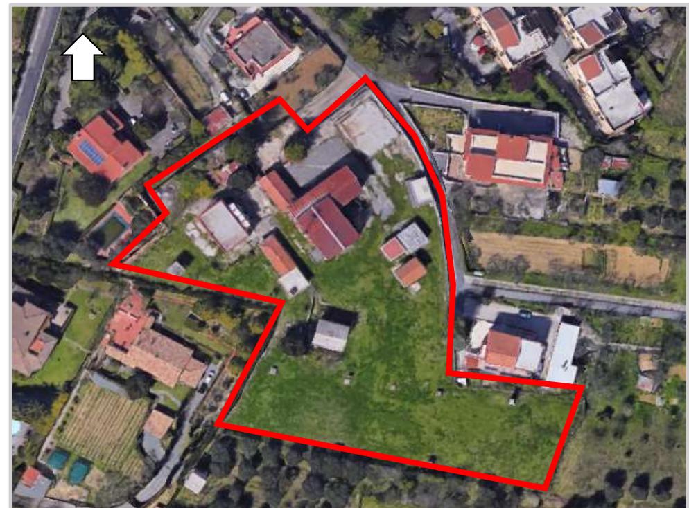
Ortofoto 2d del sedime oggetto di valorizzazione